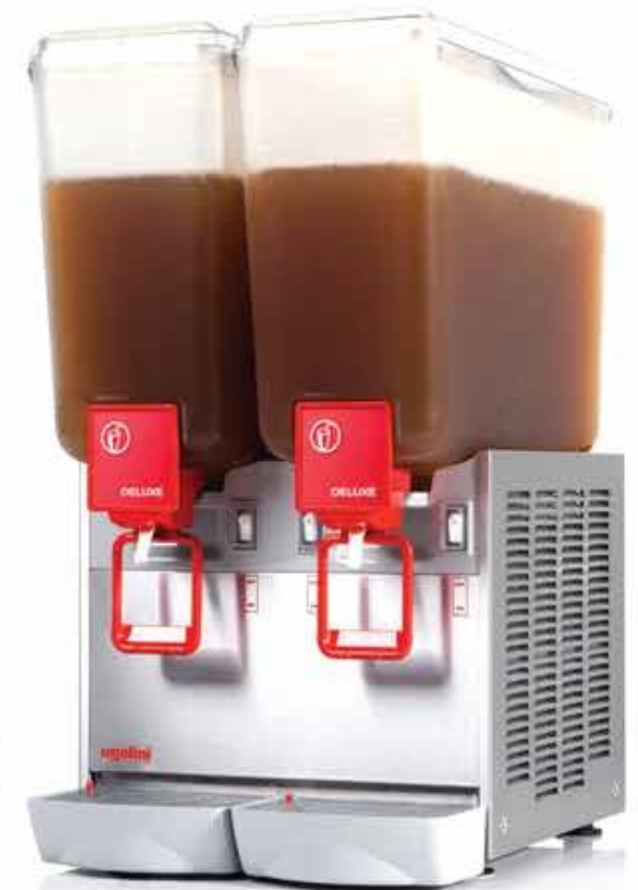
Arctic Deluxe 20 / 2 "P"