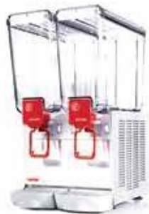
20 / 2