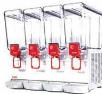
20 / 4