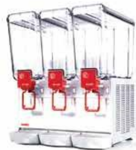
20 / 3