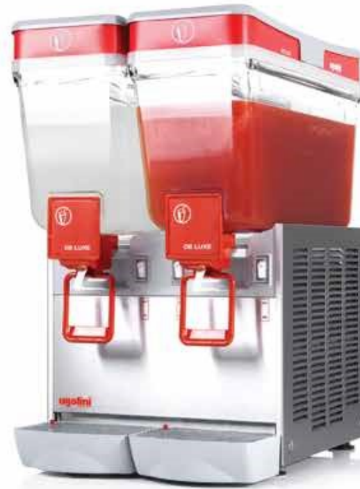
Arctic Deluxe 12 / 2 "AA"