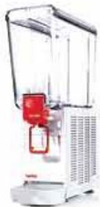
20 / 1