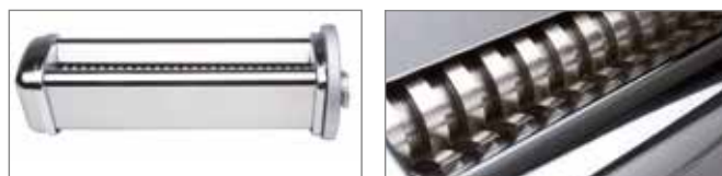
Accessorio Tagliasfoglia / Past cutting machine Accessory

it La sfogliatrice da banco 2300/SPT30-40, ad alta precisione, dispone di rulli inox larghezza mm. 300/400 appropriatamente rigati per tutti i tipi di sfoglia. Questa rigatura permette di ottenere una sfoglia leggermente ruvida per una migliore aderenza dei condimenti.