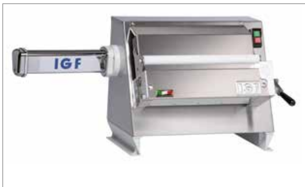
Sfogliatrice con accessorio tagliasfoglia / Sheeter with past cutting machine accessory.