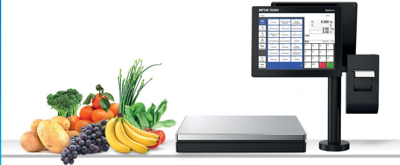
Bilancia FreshWay V

Estremamente flessibile. La bilancia touchscreen modulare FreshWay Vario di METTLER TOLEDO offre ai dettaglianti di prodotti alimentari numerose opportunità per personalizzare il layout del banco vendita secondo le proprie necessità e consente inoltre al personale di pesare i prodotti e servire i clienti più agevolmente.